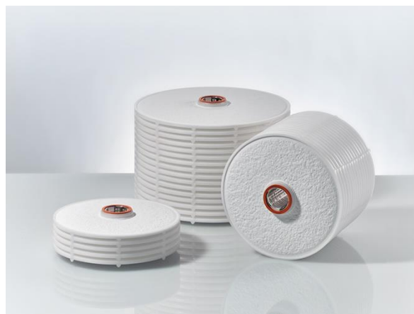
Permeabilidad al agua gama BECODISC

Módulos de filtración en profundidad BECODISC para obtener un alto grado de clarificación. Estos tipos de módulos de filtración en profundidad retienen de forma fiable las partículas más finas y reducen los gérmenes. Por ello están especialmente indicados para el almacenamiento y el llenado de líquidos sin turbiedades.