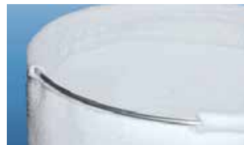
Joint d'étanchéité SNAP-RING